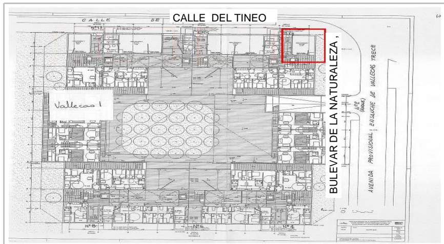
PLANO DE PROMOCIÓN